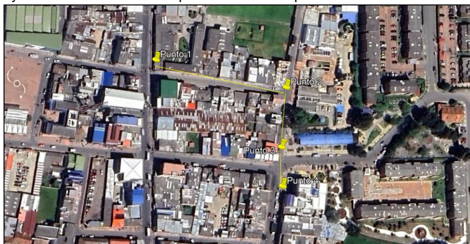
Ilustración 1. Recorrido

Se realizó recorrido de control y vigilancia en el cuadrante 4, barrio CENTRO el día 04 de junio del 2024, desde las coordenadas 4°43'5.979"N-74°12'43.844"W hasta las coordenadas 4°43'4.823"N- 74°12'39.122"W (ver ilustración 1. Ruta amarilla), con el fin de verificar las condiciones ambientales, identificar posibles afectaciones a los recursos naturales y realizar las acciones de prevención correspondientes.