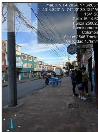
Ilustración 2. Evidencias recorrido